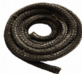
芯入りロープガスケット 18355