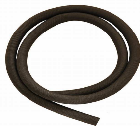
パイプガスケット 44512

注) 通常のご使用状態の場合、フロントドア用ガスケットは、3年に1度、アッシュパンドア用ガスケットは6年に1度を目安に交換ください。