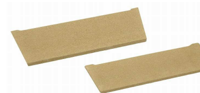
バッフルプレート 42279/43519

注) バッフルプレートに薪などを強くぶつけると破損の原因となります。十分にご注意ください。