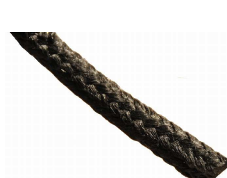
芯入りロープガスケット 18355(拡大)