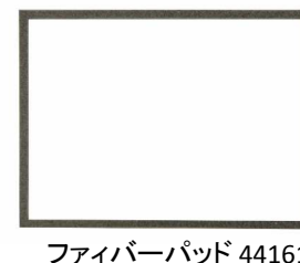
ファイバーパッド 44161

注) フロントドアガラスを交換される場合は、ファイバーパットも併せてご購入ください。