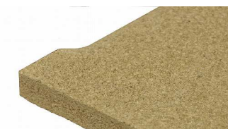
バッフルプレート(拡大)