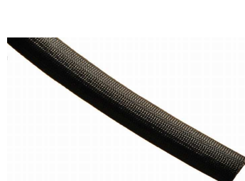
パイプガスケット 44512(拡大)